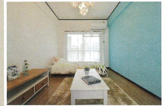
アクセントクロスがおしゃれなお部屋です♪